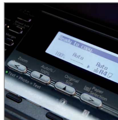
PANNELLO DI CONTROLLO di facile utilizzo con accesso rapido alle funzioni