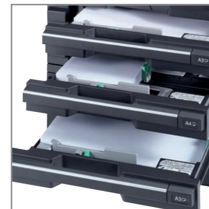
TRE CASSETTI OPZIONALI da 300 fogli/cad